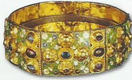
3 La Regina Teodolinda e la corona ferrea.