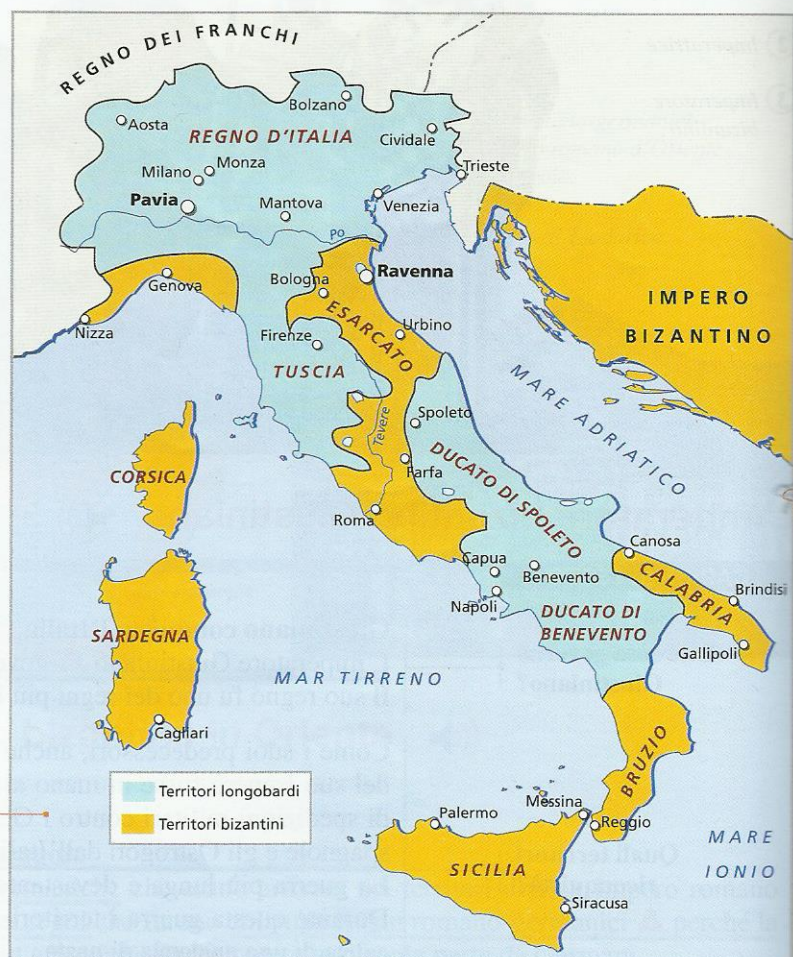
2 L'Italia divisa tra Longobardi (in azzurro) e Bizantini (in arancio).