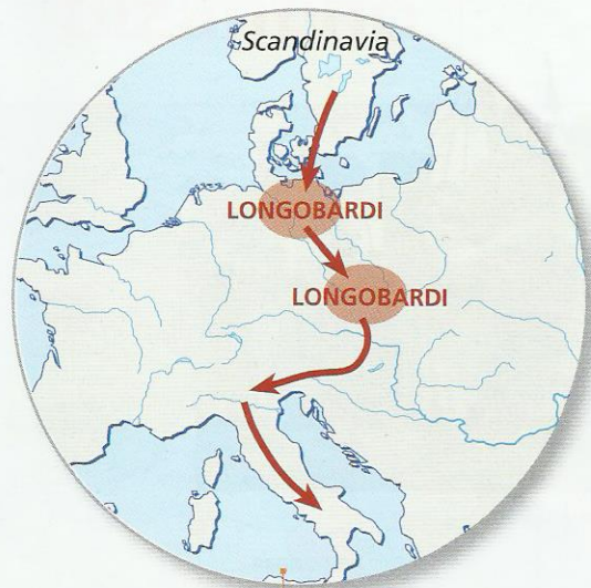
1 La discesa dei Longobardi in Italia.